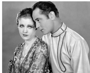
1927 FRIVOLITÉS (Fashions for Women) de Dorothy Arzner avec Einar Hanson