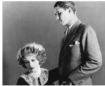
1924 LE MÂT DE COCAGNE (The Goose hangs high) de James Cruze avec Edward Peil Jr