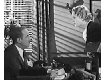
1935 LA JOYEUSE AVENTURE (Ladies Crave Excitement) de Nick Grinde avec Purnell Pratt