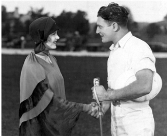
1925 PAPA SPÉCULE (Womanhandled) de Gregory La Cava avec Richard Dix