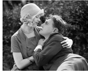
1925 CHAMPION 13 (The Lucky Devil) de Frank Tuttle avec Richard Dix