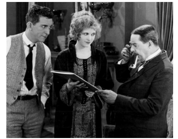
1925 JAZZ (Beggars on Horseback) de James Cruze avec Edward Everett Horton