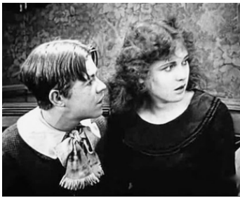
1919 HUCKLEBERRY FINN (Huckleberry Finn) de William Desmond Taylor avec Lewis Sargent