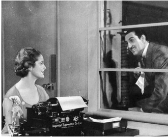
1932 AFTER THE BALL de Milton Rosmer avec Basil Rathbone