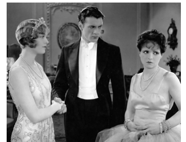
1927 LES ENFANTS DU DIVORCE (Children of Divorce) de F. Lloyd avec G. Cooper, Clara Bow