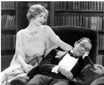
1926 VÉNUS MODERNE (The American Venus) de Frank Tuttle avec Kenneth MacKenna