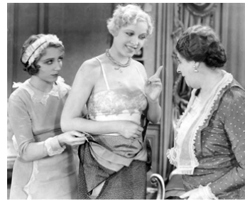
1930 LONELY WIVES de Russell Mack avec Georgette Rhodes, Maude Eburne