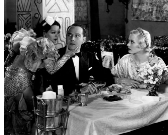
1934 ATTAQUE AU MEXIQUE (The Marines are coming) de D. Howard avec Armida, W. Haines