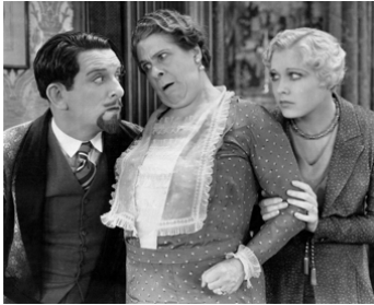
1925 LORSQU'ON EST 3 (The Troubles with Wives) de M. St. Clair avec E. E. Horton, M. Eburne