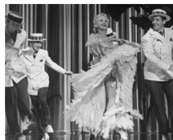
1940 ADIEU BROADWAY (Tin Pan Alley) de Walter Lang