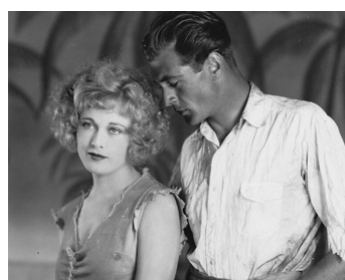
1928 MARIAGE À L'ESSAI (Half a Bride) de Gregory La Cava avec Gary Cooper