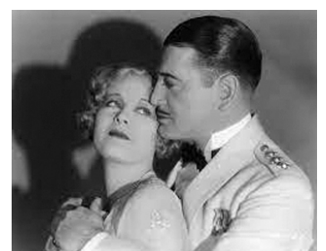
1929 LA ROUE ÉTERNELLE (The Wheel of Life) de Victor Schertzinger avec Richard Dix