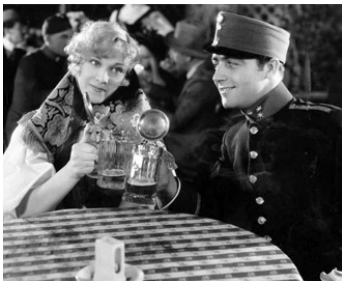
1929 LE CALVAIRE DE LENA X (The Case of Lena Smith) de Josef von Sternberg avec James Hall