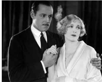
1926 JUSTICE (The Blind Goddess) de Victor Fleming avec Jack Holt