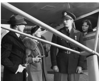
1937 THE SPY RING de Joseph H. Lewis avec William Hall, Jane Wyman