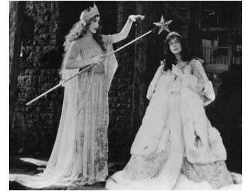
1925 UN BAISER POUR CENDRILLON (A Kiss for Cinderella) d'H. Brenon avec Betty Bronson