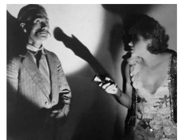
1928 ÉPOUVANTE (Something Always Happens) de Frank Tuttle avec Sojin Kamiyama