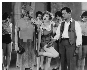
1927 TEN MODERN COMMANDMENTS de Dorothy Arzner avec Roscoe Karns