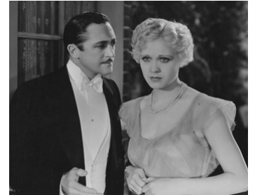
1934 MONSIEUR DYNAMITE (Mister Dynamite) d'Alan Crosland avec Edmund Lowe