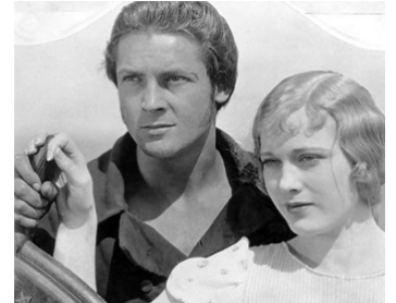
1926 VAINCRE OU MOURIR (Old Ironsides) de James Cruze avec Charles Farrell