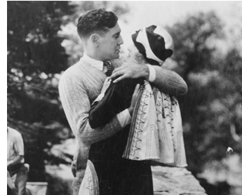
1926 THE QUARTERBACK de Fred C. Newmeyer avec Richard Dix