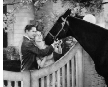
1933 BEAUTÉ NOIRE (Black Beauty) de Phil Rosen avec Alexander Kirkland