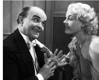
1934 CHANSON SOUS LA PLUIE (Romance in the Rain) de Stuart Walker avec Victor Moore