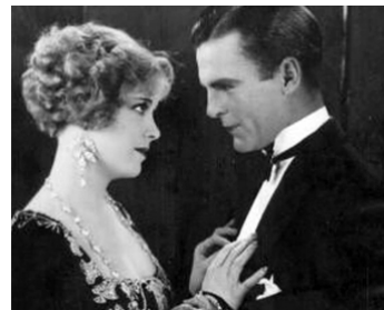
1927 LE DOUBLE VISAGE (The Spotlight) de Frank Tuttle avec Neil Hamilton