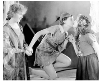
1924 PETER PAN (Peter Pan) d'Herbert Brenon avec Betty Bronson, Mary Brian