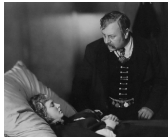
1929 MENSONGES (Betrayal) de Lewis Milestone avec Emil Jannings