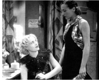
1934 VIVRE ET AIMER (Sadie McKee) de Clarence Brown avec Joan Crawford