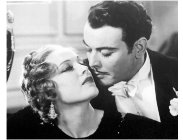
1933 COURT-CIRCUIT (By Candlelight) de James Whale avec Nils Asther