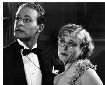
1928 CONDAMNEZ-MOI (Love and Learn) de Frank Tuttle avec Lane Chandler