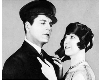
1925 THE BEST PEOPLE de Sidney Olcott avec Warner Baxter