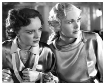
1935 TOGETHER WE LIVE de Willard Mack avec Sheila Mannors