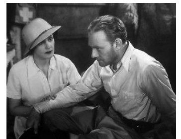
1936 LA DAME DE MANDALAY (The Girl from Mandalay) d'H. Bretherton avec Conrad Nagel