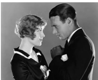
1927 MON PATRON ET MOI (Figures don't lie) d'A. Edward Sutherland avec Richard Arlen