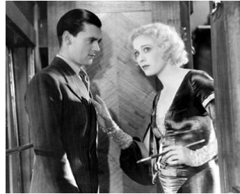
1932 ROME-EXPRESS (Rome Express) de Walter Forde avec Hugh Williams