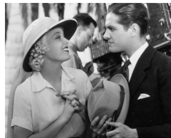
1936 HOLLYWOOD BOULEVARD de Robert Florey avec Robert Cummings