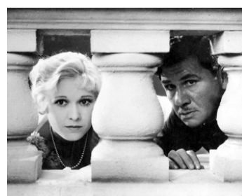
1929 FORCE (The Mighty) de John Cromwell avec George Bancroft